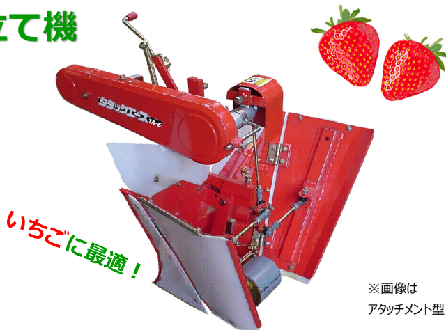
※画像は アタッチメント型